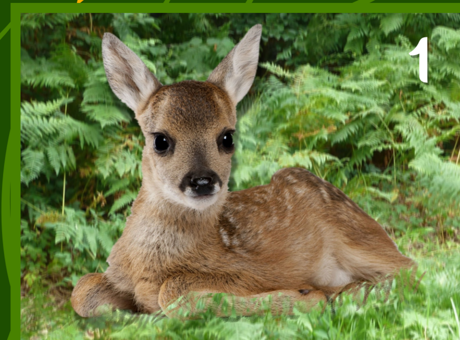
1. Le FAON petit du chevreuil