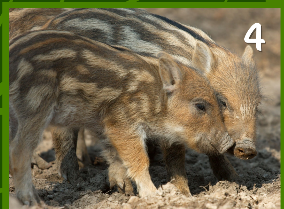
4. Le MARCASSIN petit du sanglier et de la laie