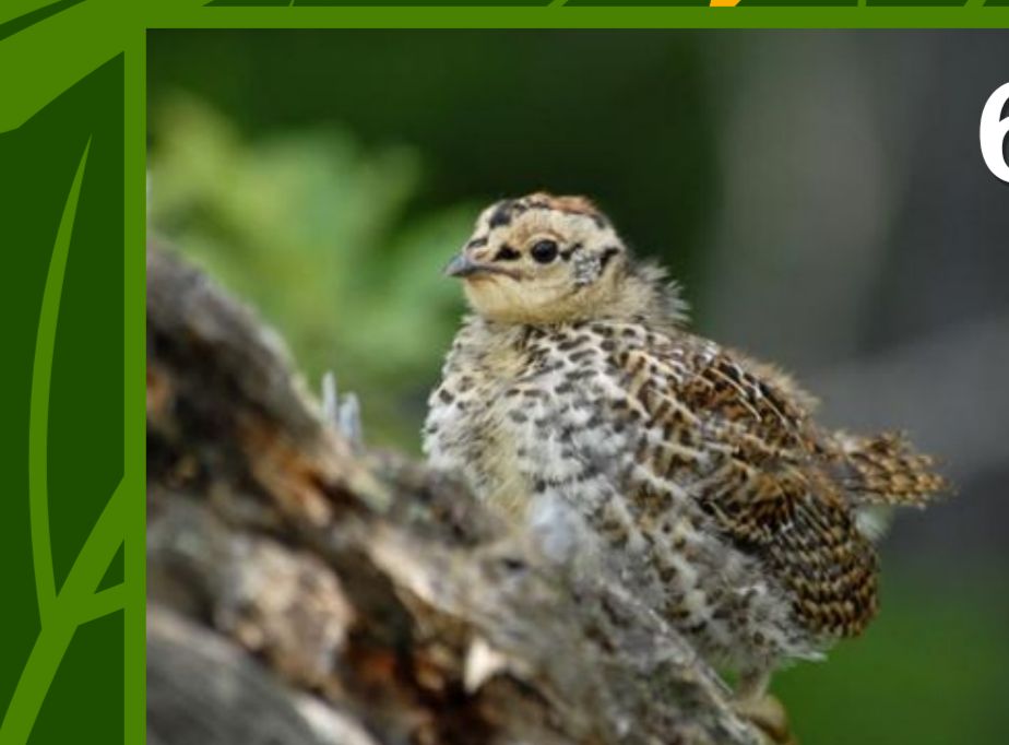
6. Le POUSSIN petit du tétras-lyre et de la poule