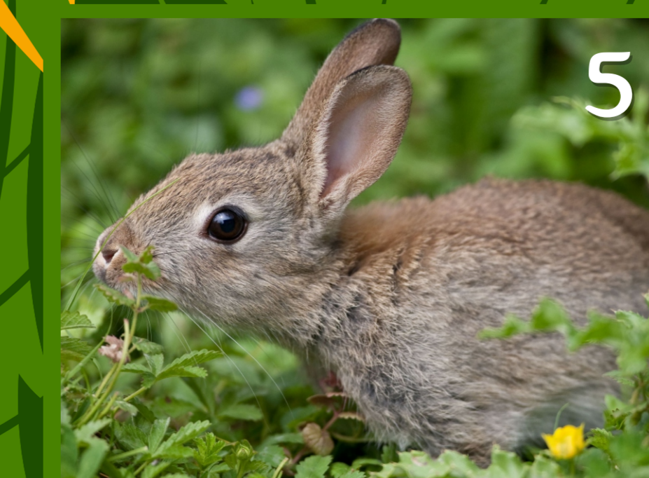
5. Le LEVRAUT petit du lièvre et de la hase