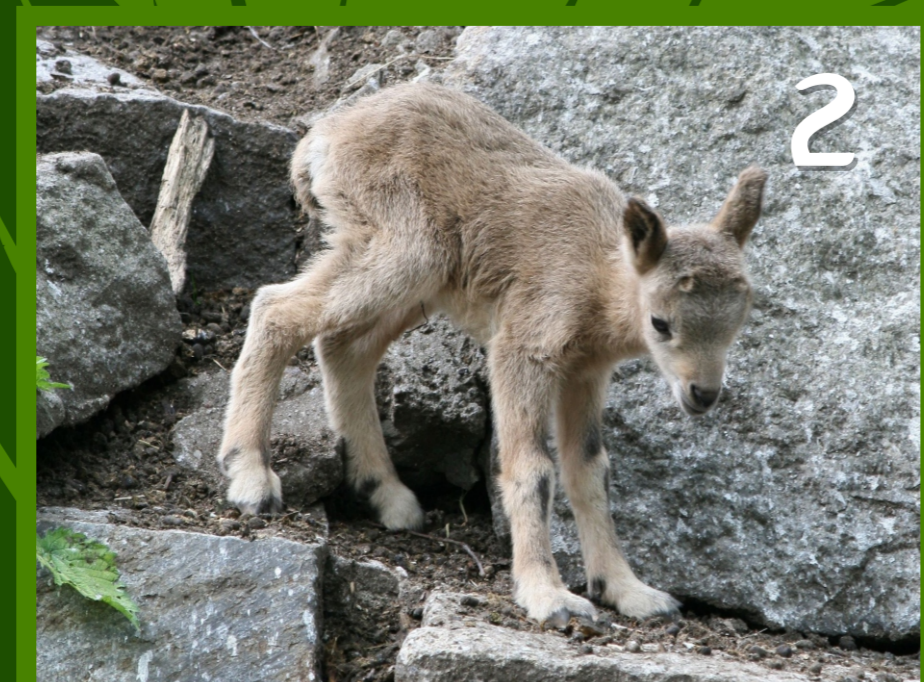
2. Le CABRI petit du bouquetin et de l'étagne