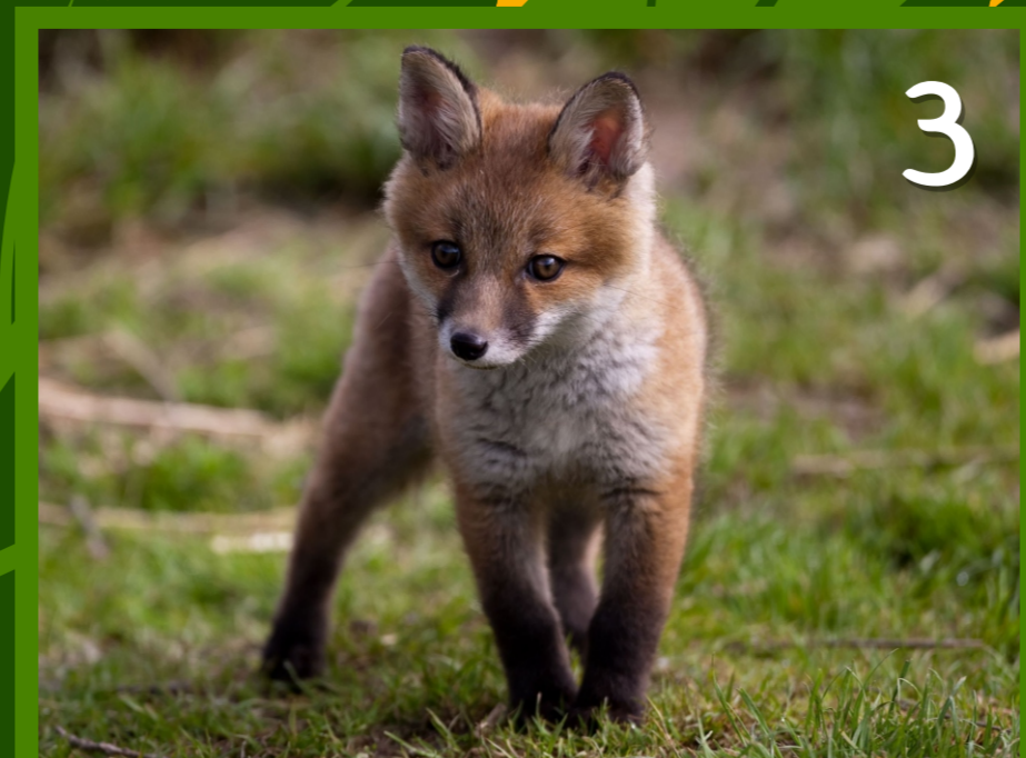
3. Le RENARDEAU petit du renard et de la renarde